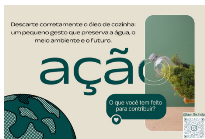
Figura 1. Material educativa disponível na ação de conscientização no Festival Gastronômico de Tiradentes.

O projeto contou com 5 etapas, sendo a primeira de pesquisa bibliográfica sobre a poluição do Rio das Mortes; segunda etapa foi elaboração e intervenção junto a eventos importantes na região como o Festival Gastronômico de Tiradentes, onde foi realizada intervenção de conscientização sobre o melhor descarte de resíduos da cozinha em locais e ambientes adequados, na tentativa de diminuir o descarte e a poluição do rio, para isso foi entregue material educativa (Figura 1).