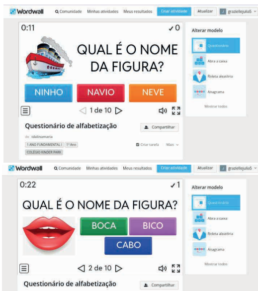
Jogo da plataforma Wordwall

Outro recurso tecnológico é o “wordwall”, ele é uma plataforma online em que o professor pode criar atividades em formato de jogos baseado nos conteúdos de alfabetização e pode levar para ser usado como um método para alfabetizar um aluno com dislexia.