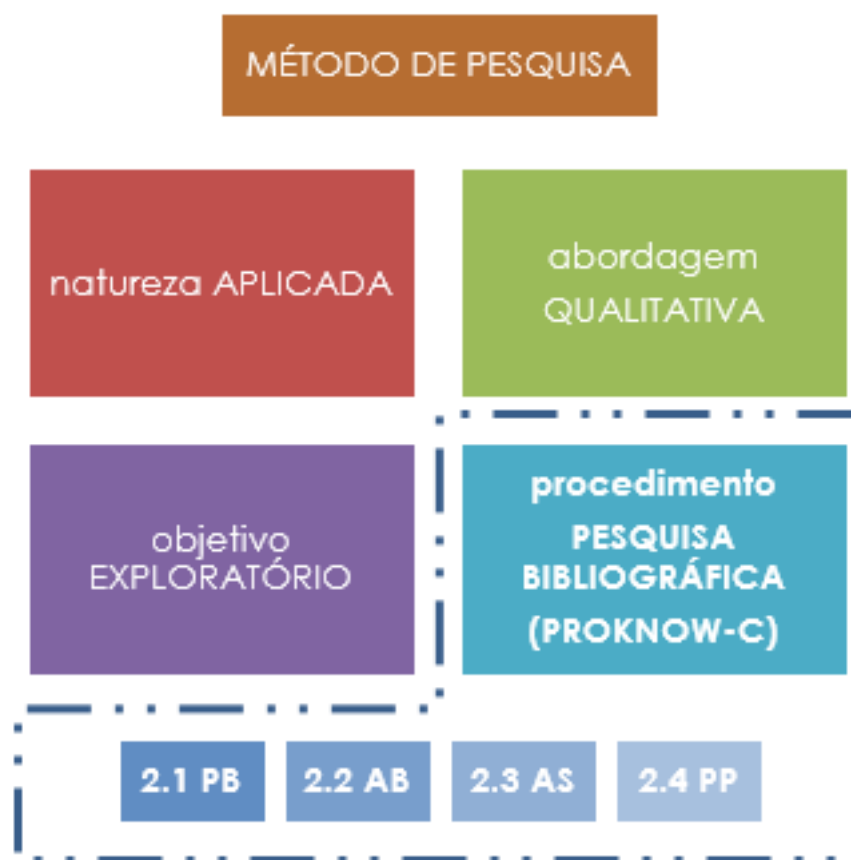
Figura 1 – Enquadramento Metodológico e sistematização dos procedimentos bibliográficos adotados

O instrumento utilizado abarcou 4 etapas (Figura 1): seleção Portifólio Bibliográfico (PB); Análise Bibliométrica (AB); Análise Sistêmica (AS) e definição de Pergunta de Pesquisa (PP) (ENSSLIN et al. , 2013).