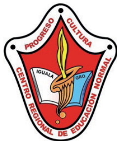
Centro Regional de Educación normal de Iguala, Guerrero, México.